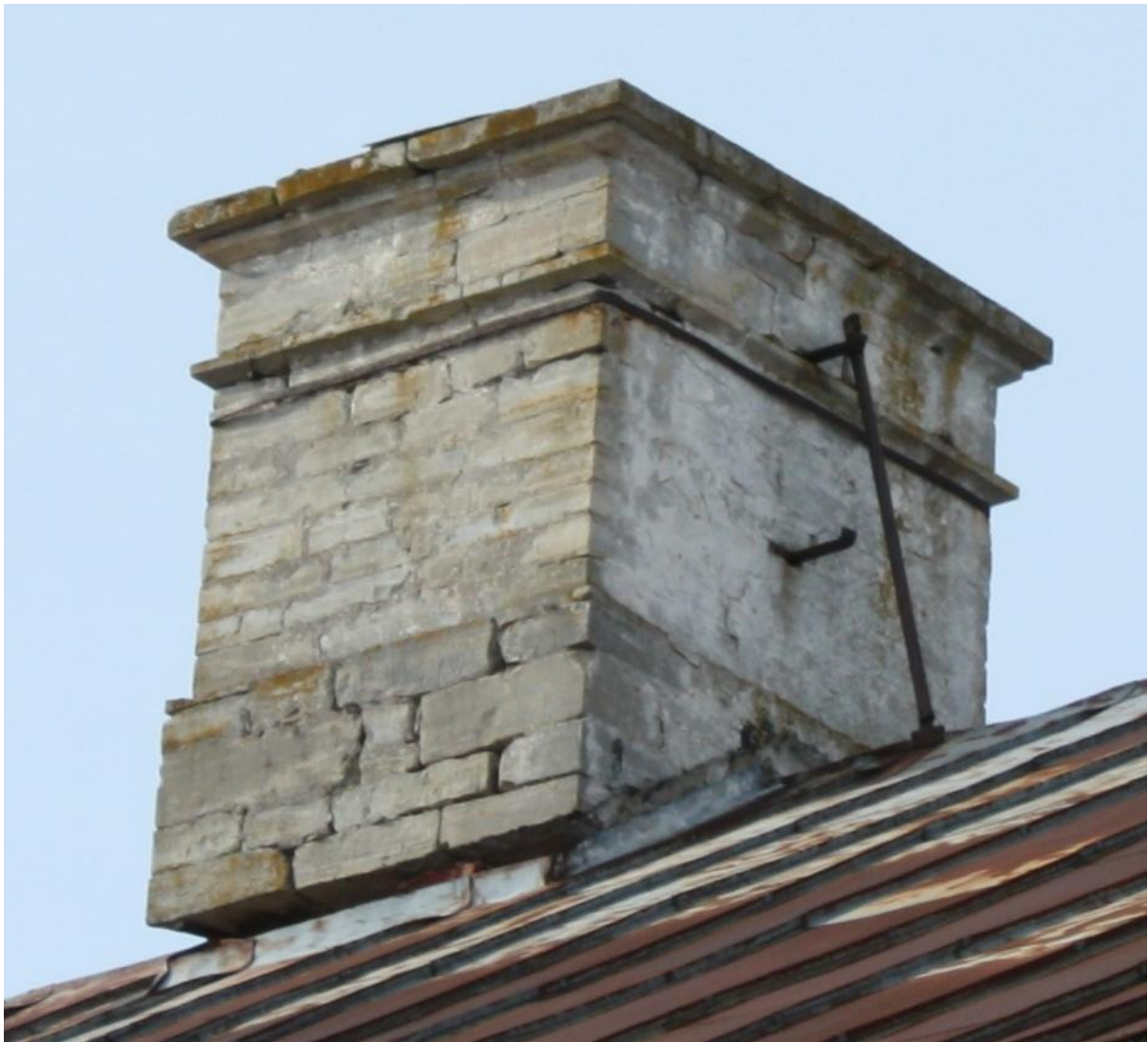
Korstnapits Kiideva mõisas. (Foto 2011)

Jooniselt on näha, et katteplekk astub üle karniisi serva 30 ... 50 mm, jättes karniisprofili kogu ulatuses nähtavaks.