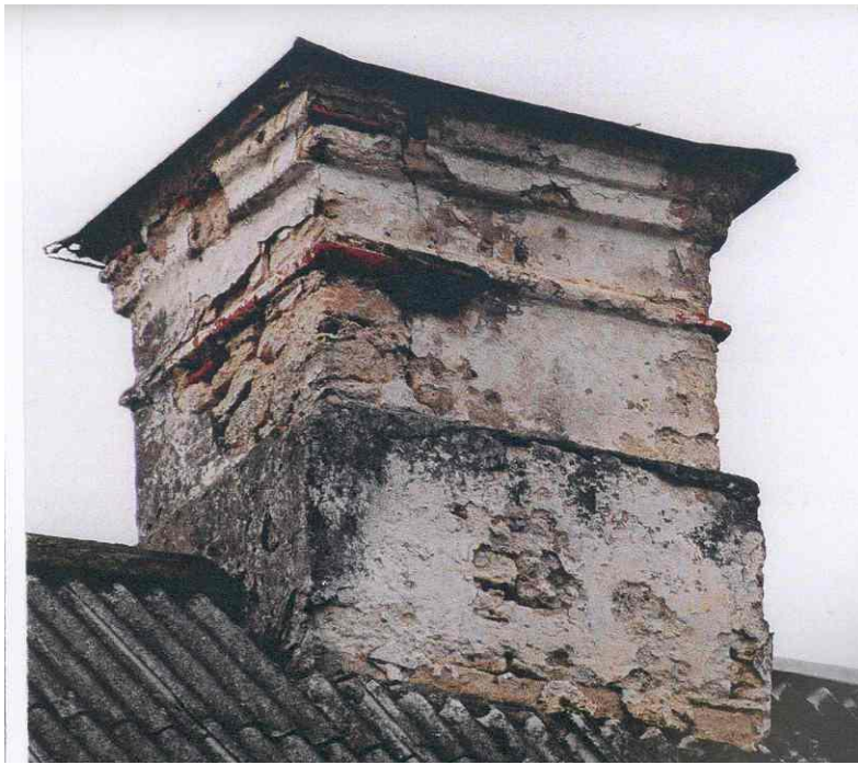
Arvatavasti algne korstnapits Kurisoo mõisas.