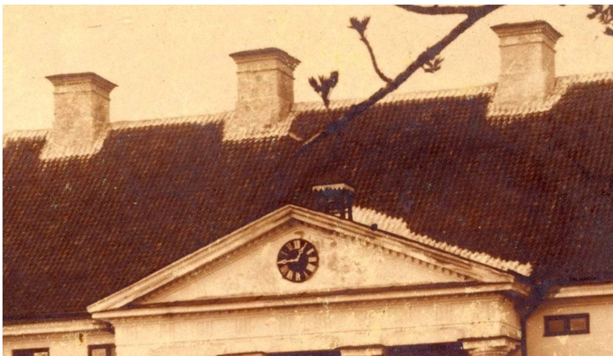
Korstnapitsid klassitsistlikul hoonel. (Lihula mõisa peahoone. foto ca 1910)

Plekiserva arengulugu vaata Fotod kommentaaridega. Aknaplekid.