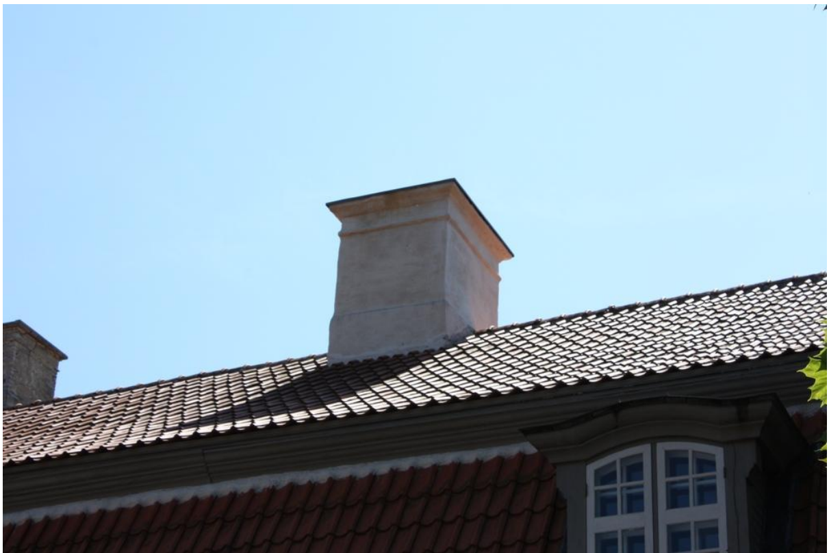
Korstnapitsid Hiu Suuremõisa mõisa peahoonel (Foto 2011)