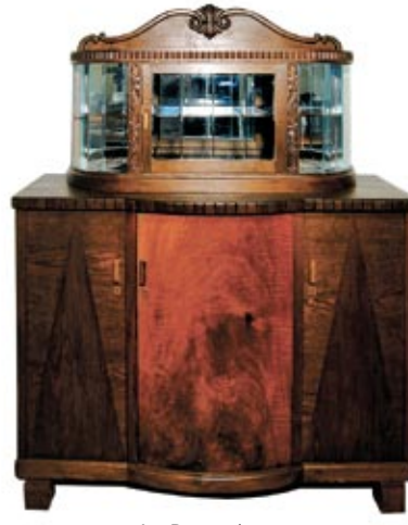
Art Deco puhvet.

Eriti armastatud olid erinevad intarsiatehnikad.