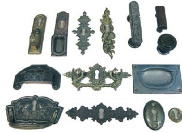
Erinevat stiili käepidemeid.

Vanadel lukkudel on tihti võtmed kaduma läinud. Puuduva võtme pärast ei maksa lukku välja vahetama hakata, luku järgi on võimalik lasta uus võti teha.