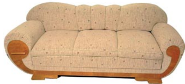
Diivan 1930. aastatest.

Materjalidest leidsid kasutust kallid ja hoolikalt valitud väärispuiduvineer, samuti metall ja klaas. Samas tulid modernse kõrval taas ausse ajaloolised stiilid. Neohistoritsism tõlgendas varasemaid stiile suhteliselt vabalt, segades sinna juurde ka rahvusromantilisi motive. Kasutusel olid kõik varasemad dekoortehnikad: intarsia, puidulõige, treitud detailid ja dekoratiivne metallfurnituur.