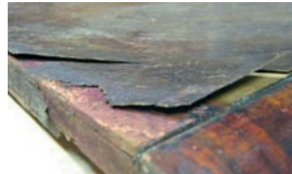
Niiskuses lahti tulnud spoon.

Mööbli tervisele mõjuvad ühtviisi halvasti nii liigne niiskus kui ka kuivus. Kindlasti ei tohiks mööblit hoida niiskes keldris või õues kuuri all. Niiskuse mõjul puit paisub ja liimühendused tulevad lahti. Selline keskkond soodustab ka hallituseente ja puidukahjurite teket.