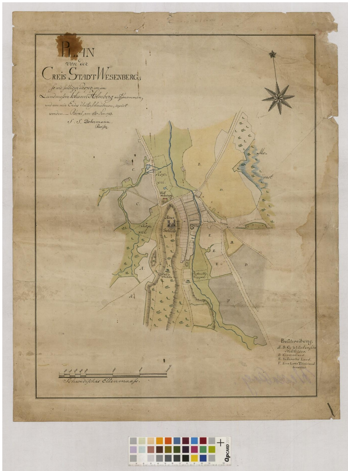
Joonis 3. Rakvere linna plaan 1783 (LVVA 6828.4.535 leht 1). Rakvere linn on laienenud lõuna suunas, samuti on välja mõõdetud krundid Soolikaojast idas. Samuti on nüüd kindlasti kasutusel kaks ülepääsu ojust. Märkimisväärne on üksik kungas linna lõunaosas muude kruntide vahel. Kas see võib markeerida mingit varasemat maamärki? Hukkamiskohta vmt?