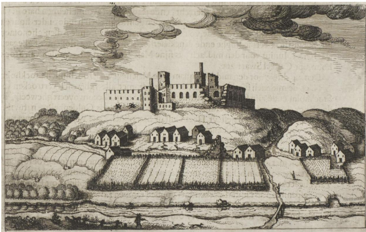
Joonis 2. Anthonis Goeteerise joonistus Rakverest 1619. Tagaplaanil linnus, ees Rakvere linn Pika tänava terrassil. Majad on kujutatud üksnes Pika tänava lääneküljele, ida pool on vaid üks hoone, ilmsetl kirik. Pika tänava lääneküljel on kujutatud linnakodanike aiamaad kuni ojani. Ka Goeteeris ei markeeri linna ojust ida pool.