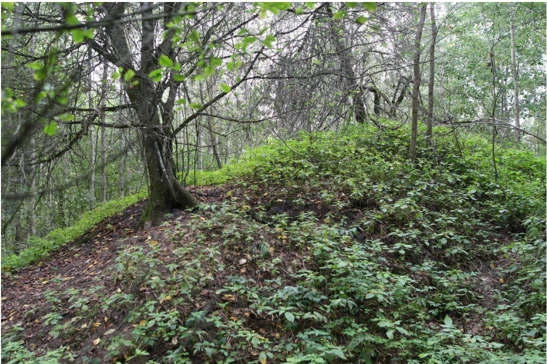
Kivide kõrval asuv suur maaparandushunnik, millest on nüüdseks saanud mägralinnak.