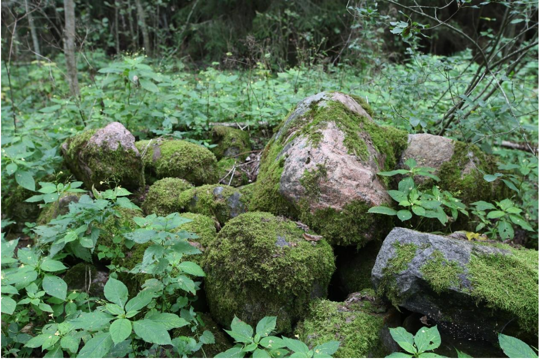
Võimalik, et kivi on põhimõtteliselt alles, ent tema leidmine teiste seast on äärmiselt keeruline. F.: L. Mäemets 2023