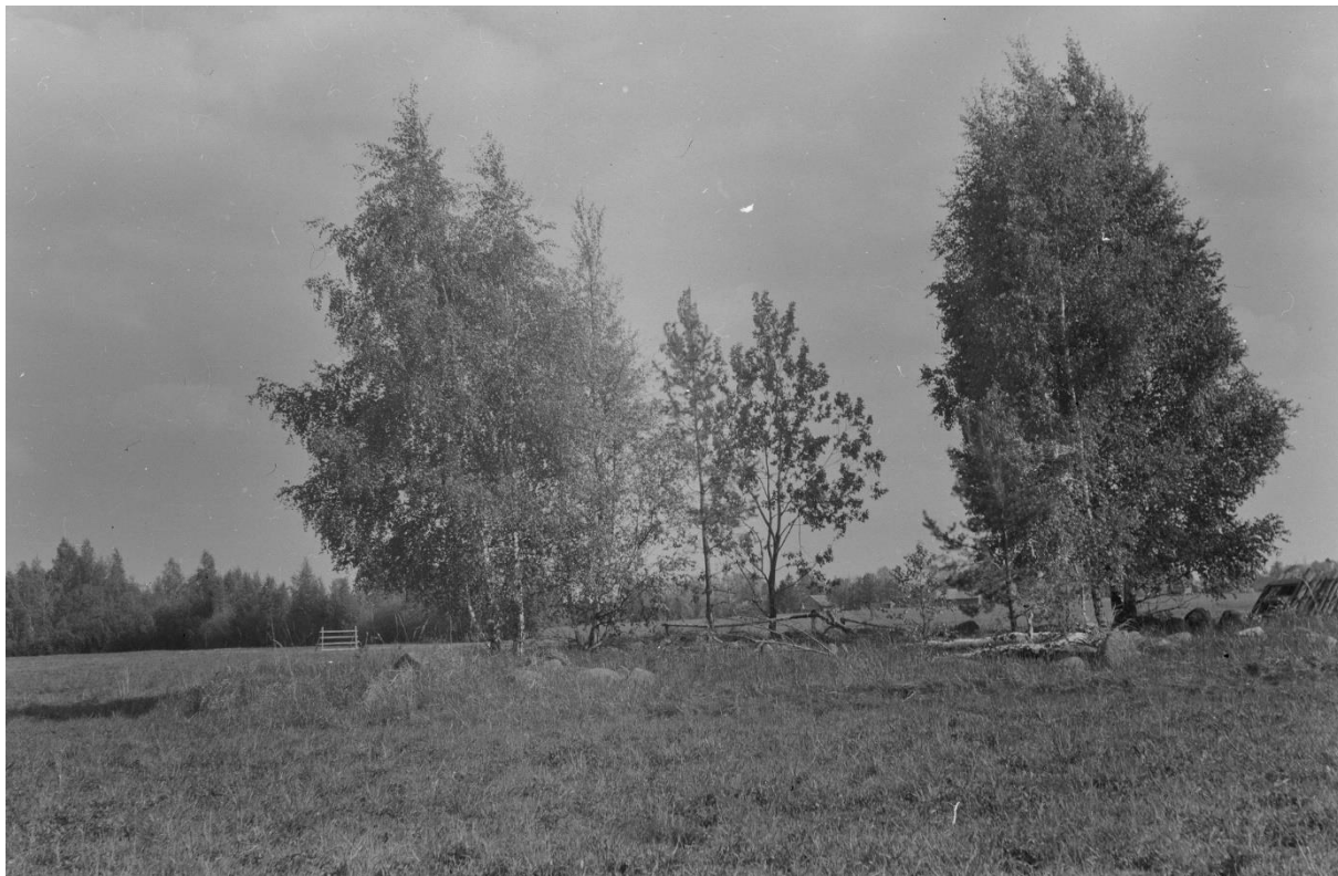
ERA, Foto 8766. Sandimärdi kalme Verevi küla juures (Rannu). Rannu khk., Verevi k. - Herbert Tampere (1968)