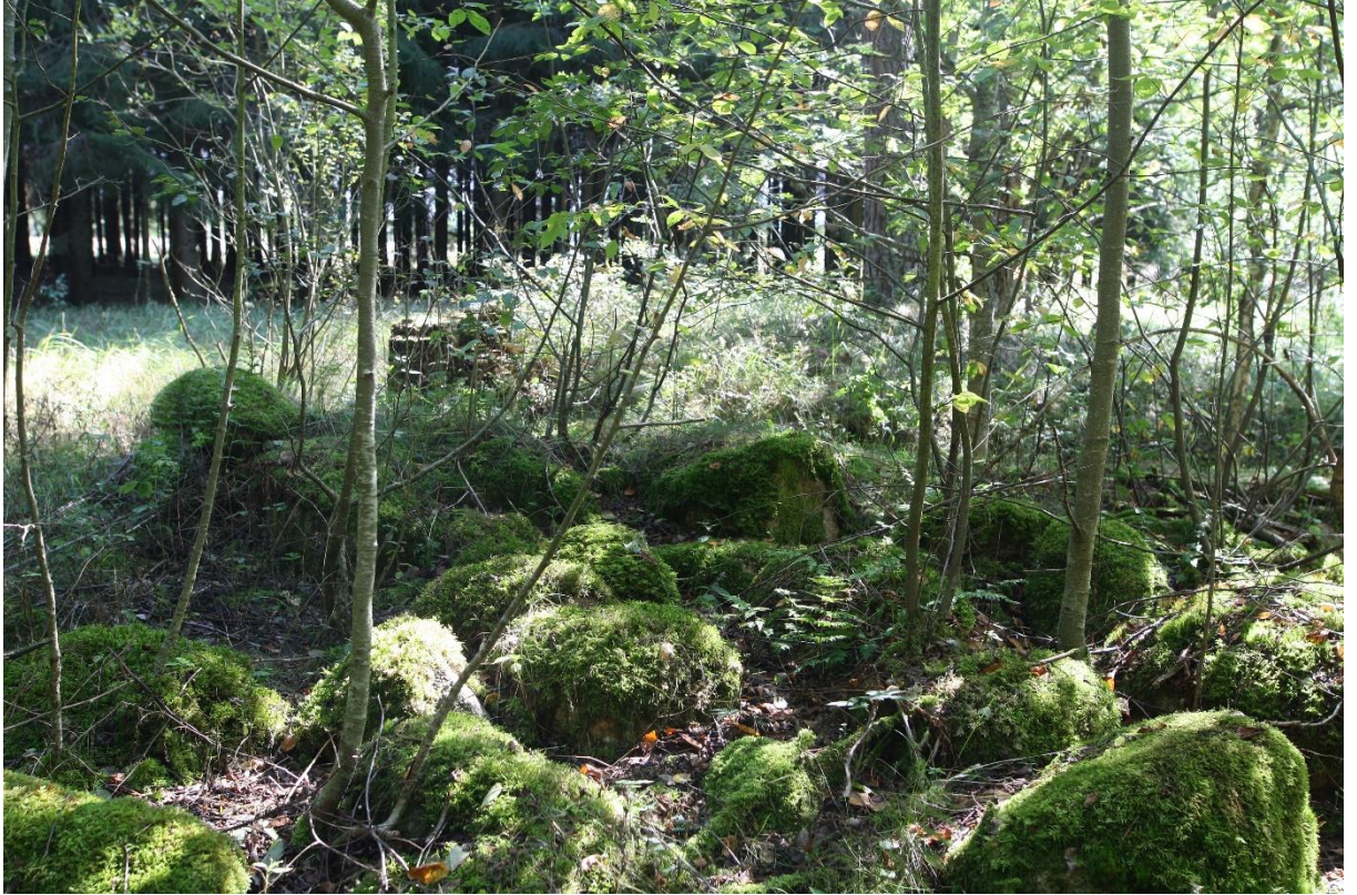
Sandimärdi kalmest on sõjaajal kaevatud läbi kaevikud. F.: L. Mäemets 2023