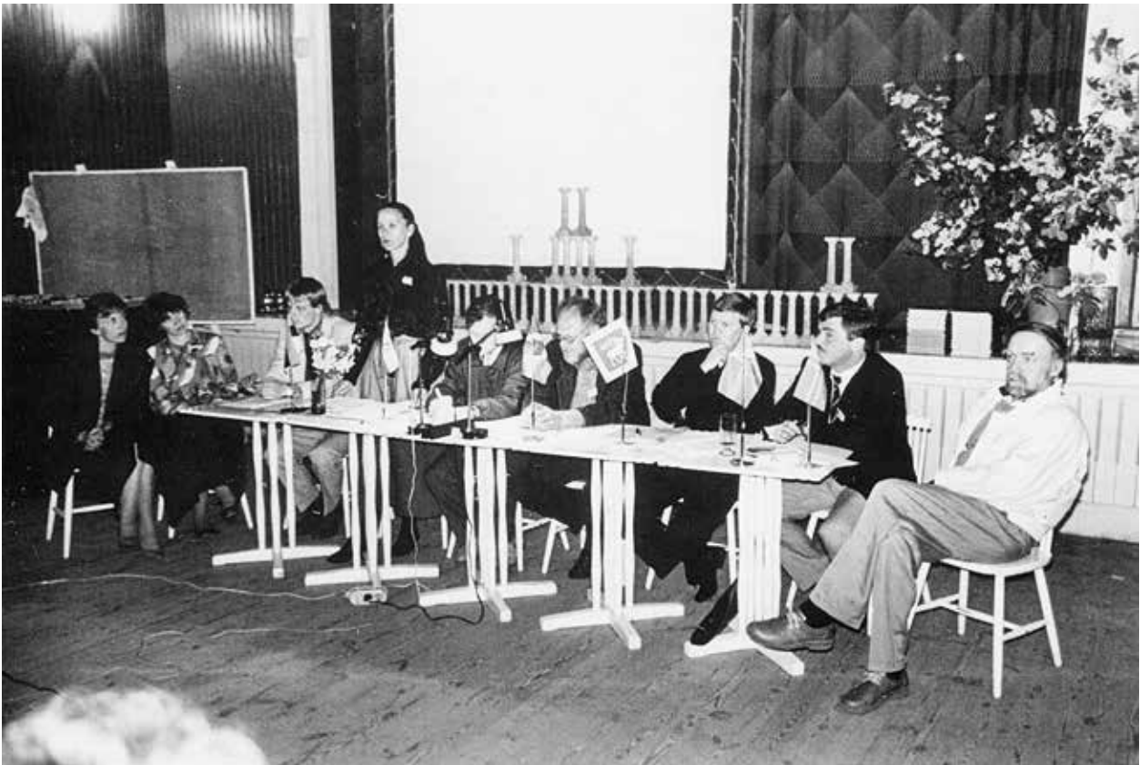
5. Esimesel Balti mere saarte arhitektuurikonverentsil sõna võtmas