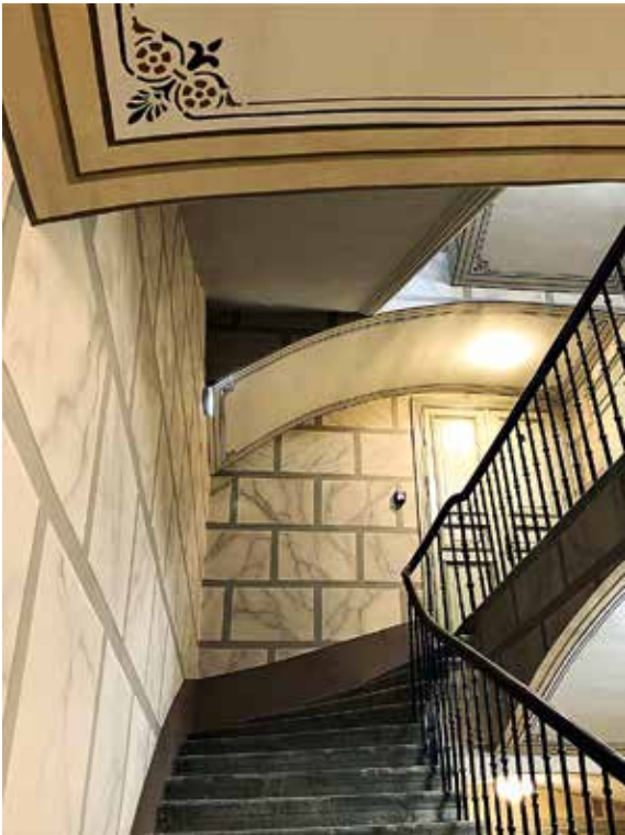
1.–2. Taastatud maalingud trepikojas ja tuulekojas.

Tallinna vanalinnas Pikk tänaval asuva maja nr 52 maalingle lugu ulatub tagasi 1980ndatesse, mil ühiskondlikus kasutuses olnud hoone renoveeriti korterelamuks. Trepikoja esimese korruse nurgast leiti lammutada plaanitud laudvoodri tagant maaling, mis imiteeris marmorplokkidest laotud seinu. Pindmiselt mustunud, kuid muidu nagu nõelasilmast tulnud maalingu head seisukorda näitavad uuringu aruandes leiduvad fotod. Tõenäoliselt ei olnud maalinguleid toonastele renoveerijatele siiski teretulnud: sellest tehti küll kontaktkoopia ja võeti mõõdud, kuid värvitoone vaid kirjeldati ja toonide näidiseid ei lisatud. Veelgi enam, järgneva renoveerimise käigus kaeti maalitud seinapind paksu kõva pahtliga. Pahtlile jooniti plokkide ja vuugijoonte skeem, mida ülevärvimisel järgiti, kuid värvitoonide valikul ei lähtunud kinnipahteldatud maalingust ning valgeid tühje plokivälju ei üritatud marmoriks maalida. Seinad jäid elutuks ning juba järgmise remondi käigus värviti trepikoda ühevärviiseks.