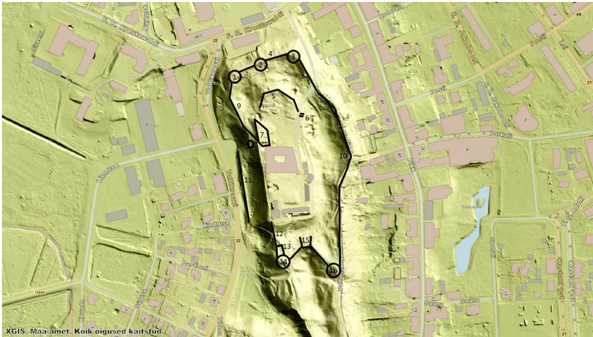
Joonis 2. Rakvere linnuse eelkaitsevööndi elemendid (Jonuks 2020, Joonis 2). 1 – loode-kindlustus, 2 – põhja-kindlustus, 3 – kirde-kindlustus, 4 – põhjavall, 5 – sisemine kaitsevall, 6 – pækivimüüridega konstruktsioon, 7 – loodebastion, 8 – kindlustus läänenõlval, 9 – läänevall, 10 – idavall, 11 – alumine läänevall, 12 – läänevall, 13 – edelakindlustuse nelinurkne osa, 14 – edelakindlustus, 15 – lõunakindlustus, 16 – kagukindlustus.